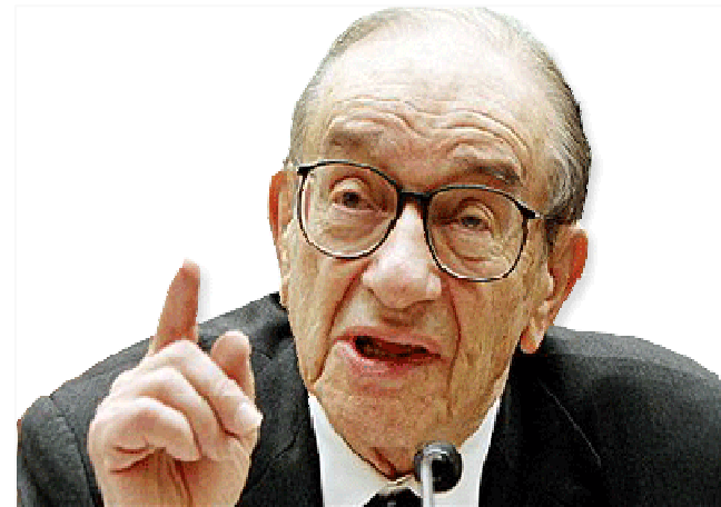
Alan Greenspan. Presidente de la Reserva Federal de EEUU (1987-2006)